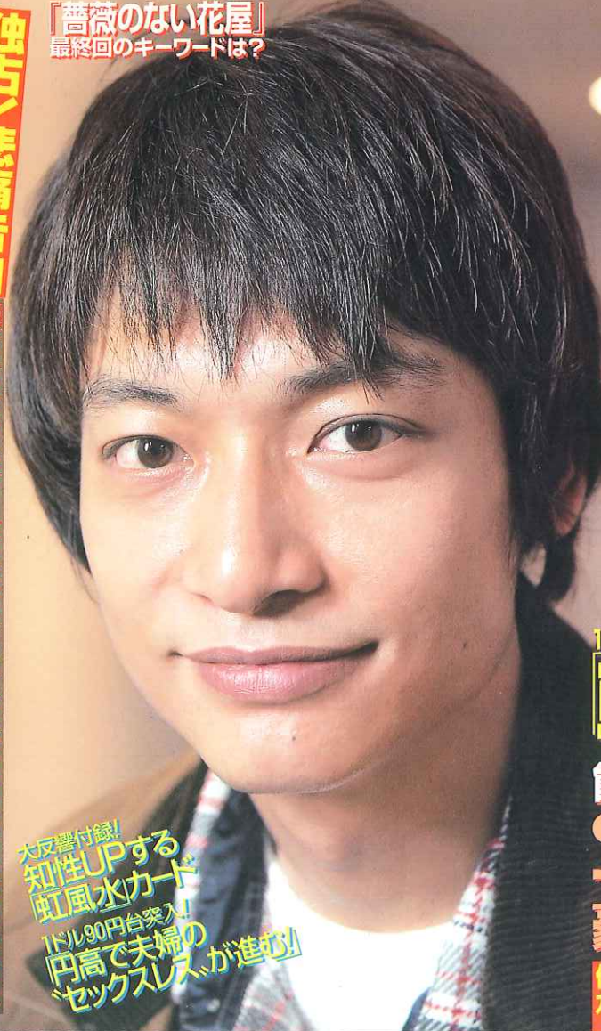
薔薇のない花屋 最終回のキーワードは?

独占! 悲痛告白 山下真司 長男 享年38 自宅まで怪死 地獄羽賀 研 狂わされて