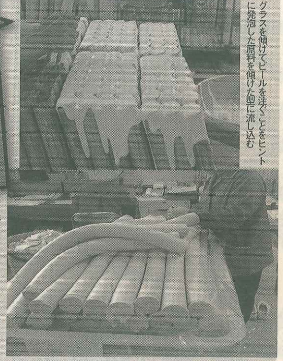
蒸し焼きにした後、型から取り出したスポンジ。蒸し乾燥・研削・検査を経て完成

絶賛される肌触りの秘密は、質の高い厳選された原毛と、「毛先を切って揃えるのはブラシで、うちのは筆なんです」という言葉どおり、毛先を切らずに揃えるという伝統の匠の技。80種類以上の工程すべてが丹精込めた手作業で、かつ効率的に量産を実現する。「現在、売り上げの95%が化粧筆ですが、これからも伝統筆を再現することがいちばん