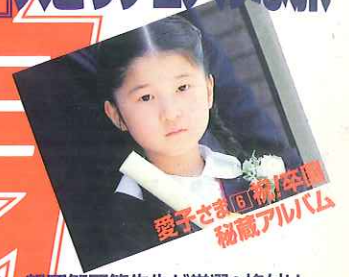
愛子さまの6歳時写真 秘蔵アルバム